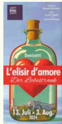
1988: „Die Geschichte vom Soldaten“ (Richard Edlinger/Heinz Holecek), 2004: „Madama Butterfly“ (Karel Drgáč), 2019: „Fidelio“ (Johannes Wildner), 2024: „L'elisir d'amore“ (Clemens Unterreiner).