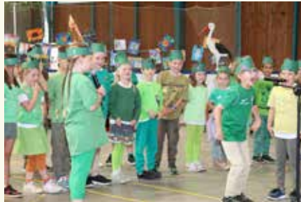
Mit Musik, Gesang, Schauspiel und großer Begeisterung gaben die Schüler:innen Einblick in den Alltag einer außergewöhnlichen Schule.